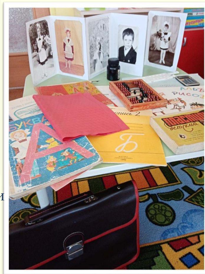
Фото альбом Наши родители - школьники