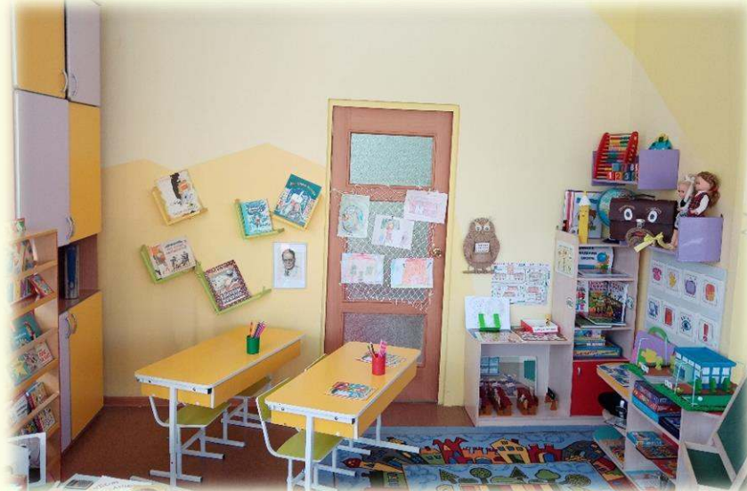
Правила поведения на уроке