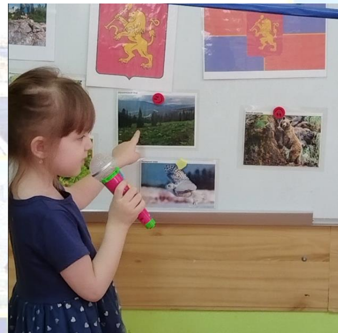
Репортажи о Красноярском крае