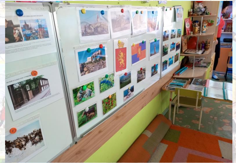
Говорящая стена «Красноярский край»