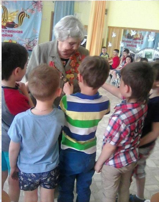
Встреча с ветеранами