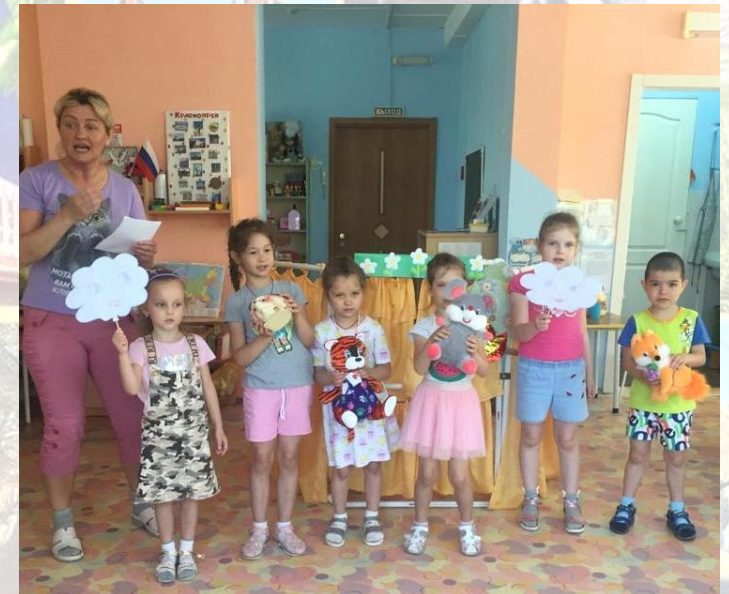
Экологическая сказка про тигренка и мышонка