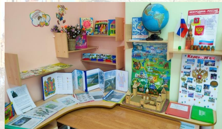
Уголок «Мой край родной»