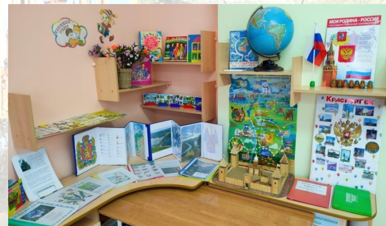
Уголок «Мой край родной»

Д/и «Назови достопримечательность Красноярска»