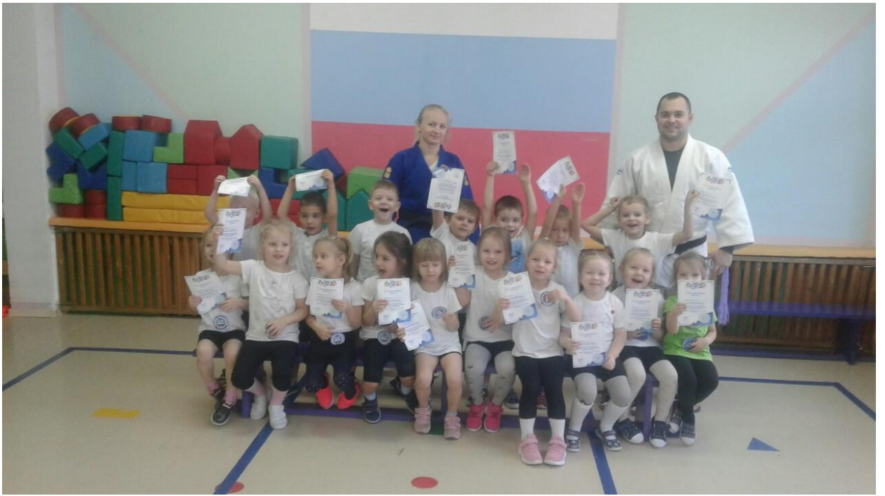
На встречу Универсиаде.